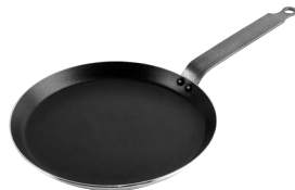
Stekpanna, låg kant