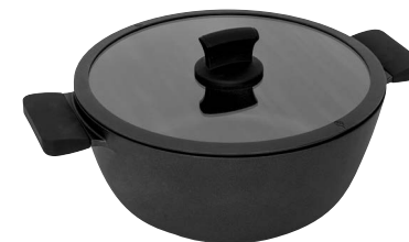
Kastrull med lock