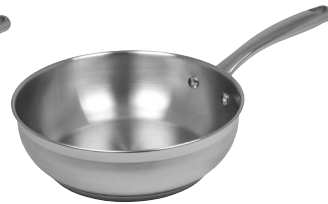
Sauteuse 63345 Ø 24 cm 3,0 L