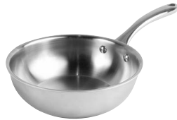
Sauteuse 63340 Ø 20 cm 1,9 L