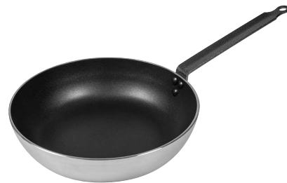
Sauteuse 63231 Ø 28 cm 3,7 L