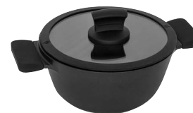
Kastrull med lock