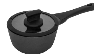
Kastrull med lock