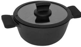
Kastrull med lock