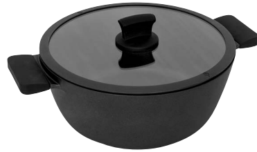
Kastrull med lock