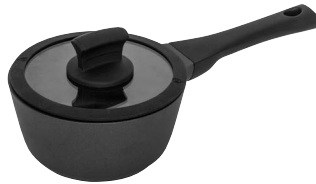
Kastrull med lock